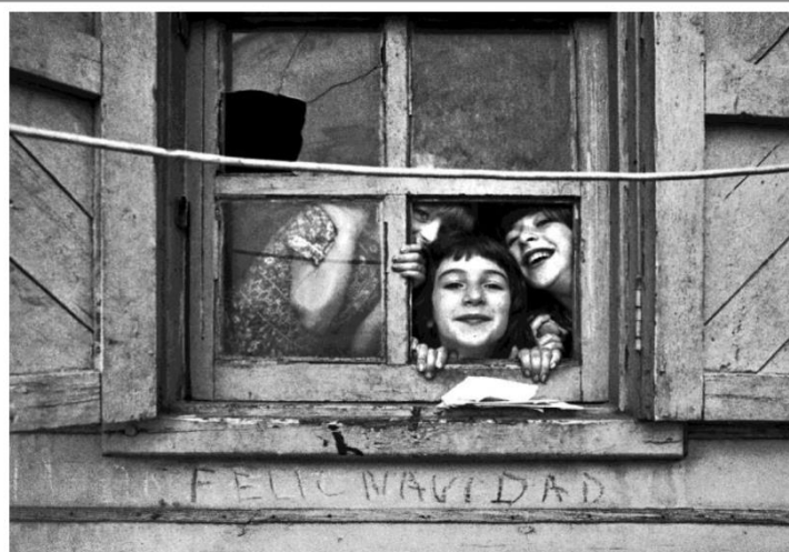
"Sant Andreu"