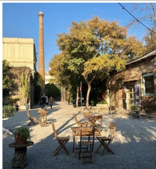
Palo Alto Barcelona