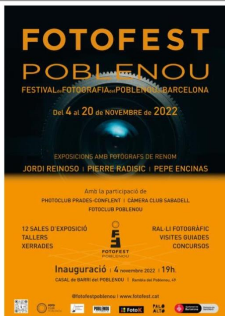
Cartell oficial del FotoFest