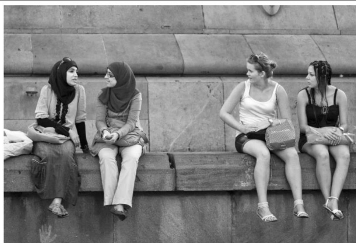
"Turistes de dos mons"