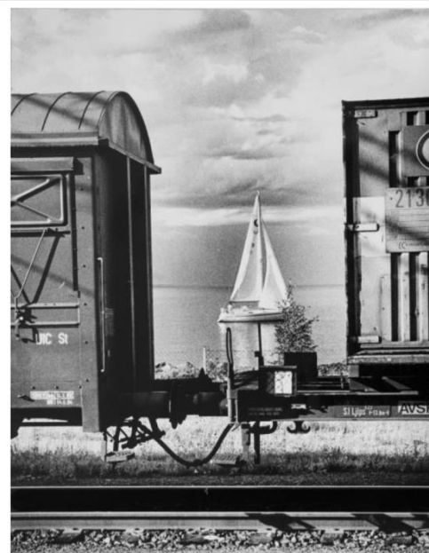
Poblenou preolímpic