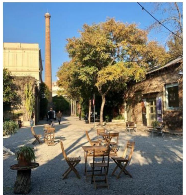
Palo Alto Barcelona