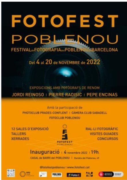
Cartell oficial del FotoFest