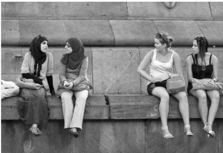
“Turistes de dos mons” © Pepe Encinas