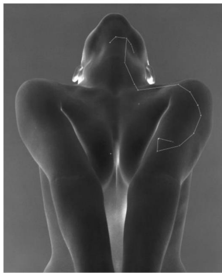
“Scorpius” © Pierre Radisic