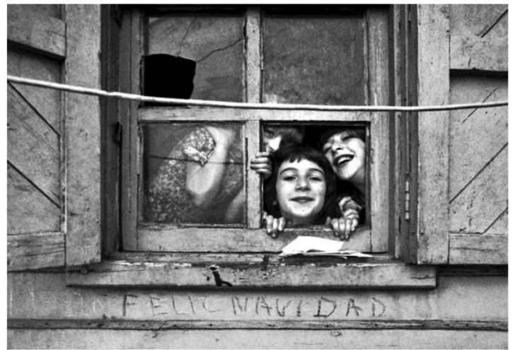
“Sant Andreu” © Pepe Encinas